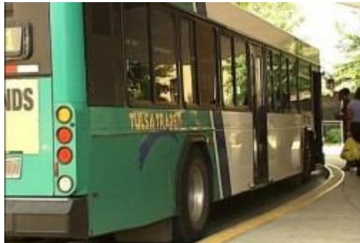
Tulsa Transit prepares for refuelling replacement CNG-powered buses arriving end of this year.

Американська компанія Trillium USA, розташована у штаті Юта, має збудувати АГНКС у штаті Оклахома для компанії Tulsa Transit, щоб та була готовою ввести в експлуатацію придбані автобуси, що працюють на природному газі, які розпочнуть надходити в кінці року, повідомляє місцеве агентство новин Tulsa World. Будівництво має розпочатись цього літа. Вартість АГНКС – 2,1 млн. дол. буде виплачена упродовж 10 років компанією Transit, завдяки заощадженню нею коштів при переході з дизельного палива на природний газ.