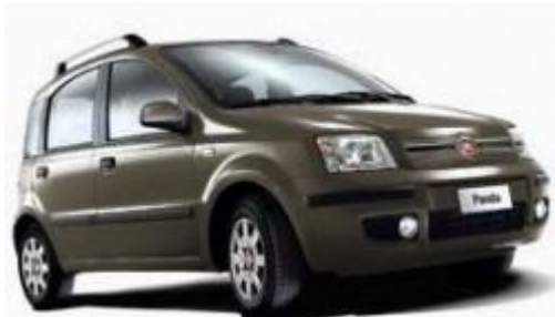
Автомобіль Fiat Panda Natural Power за економністю випередив усі позашляховики

Німецька асоціація водіїв ADAC (Allgemeiner Deutscher Automobil Club) здійснила порівняння паливної економності 241 сучасних моделей автомобілів на різних видах палива. Метою випробовування було побачити, яку відстань може проїхати автомобіль за 30 євро (36,70 дол. США). Автомобіль Fiat Panda 1.2 8V Natural Power був однозначним переможцем змагань, подо-