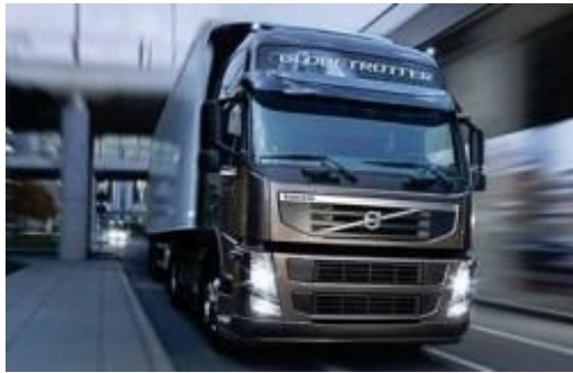
Компанія CAP розробила двопаливну систему для переобладнання сидельних тягачів Volvo FM

Після 12-місячного успішного випробовування вантажного автомобіля Mercedes Axor з використанням обладнання фірми Genesis, компанія Clean Air Power (CAP) отримала замовлення від групи компаній HAM на 10 комплектів обладнання Genesis EDGE Dual-Fuel – для переобладнання сидельних тягачів Volvo FM. Вартість замовлення становить приблизно 200000 фунтів стерлінга (290000 дол. США). Компанія CAP заявляє, що обладнання фірми Genesis EDGE є більш