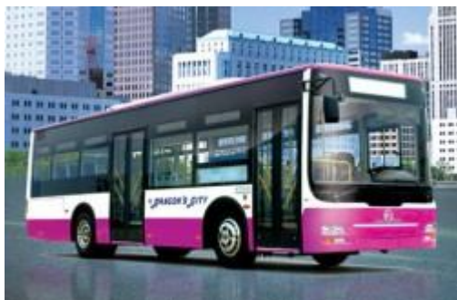
Автобус компанії Golden Dragon - XML6105J13CN LNG

У кінці минулого року компанія Golden Dragon Bus виграла тендер на постачання 60 зі 100 автобусів двигуни яких мають працювати на зрідженому природному газі (ЗПГ). Тендер проводила транспортна компанія міста Ксіаошан. Перша партія з 20 автобусів моделі XML6105J13CN LNG була пущена в роботу у січні. Також збудована газонаповнювальна станція на ЗПГ.