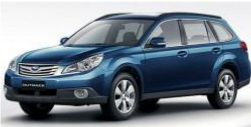
Автомобіль Subaru Outback 2.5 розглядається як ціль для конвертації

Північноєвропейська секція японського автовиробника Subaru розглядає доцільність постачання газобалонних автомобілів у Швецію, можливо з використанням потужностей Saab Automobile, які не використовуються. Компанія Subaru Nordic підтверджує свої плани про конвертацію автомобілів Legacy і Outback для роботи на стисненому природному газі (СПГ).