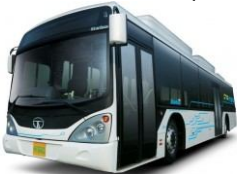
Електричний гібрид Tata, що працює на СПГ

У місті Мумбай автобусною компанією Brihanmumbai Electric Supply and Transport Undertaking (BEST) на вулицях будуть випробовуватись два гібридних автобуси Tata Motors що працюють на СПГ.